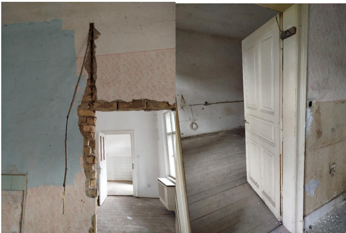
Fsz. 4. lakás. Nem szabványos elektromos hálózat, valamint elavult padló és falburkolatok. A kivágott nyílás falzatába nem helyezték el az áthidaló gerendát.