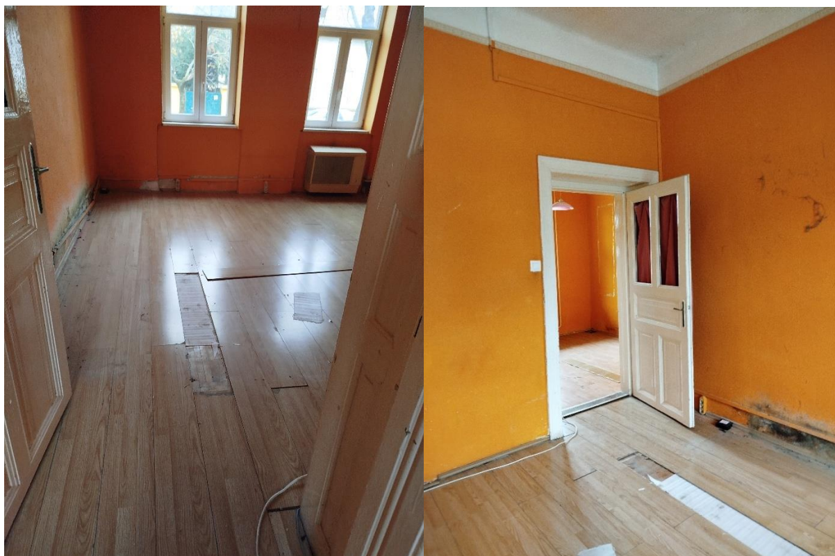
Fsz. 2 lakás Szobai laminált parketta burkolat hiányos, az oldalfalon vizesedés nyoma látható.