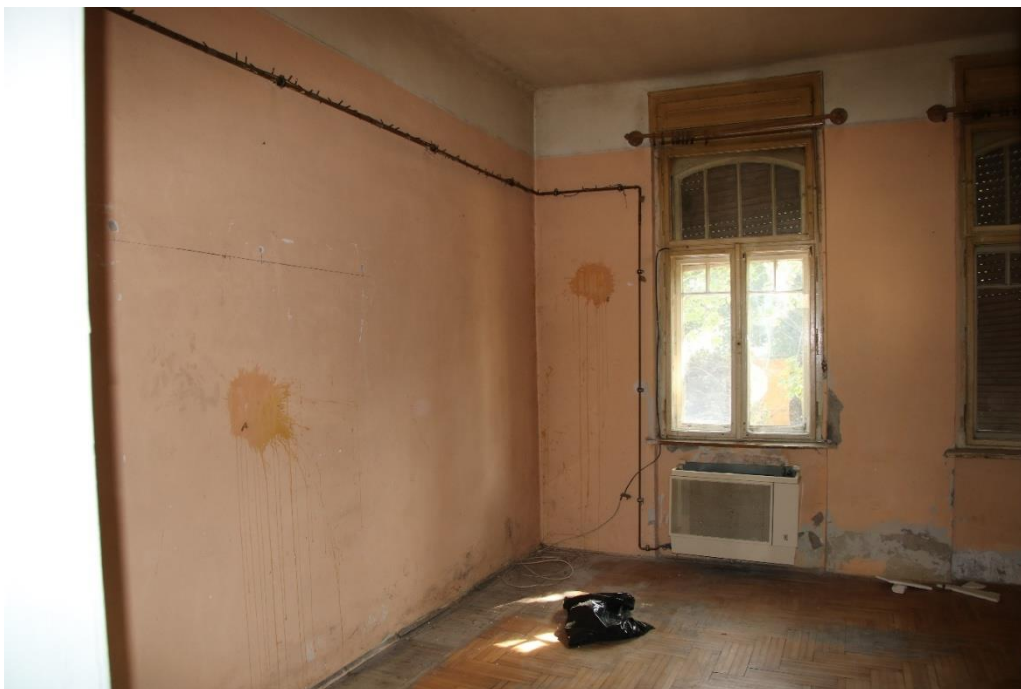
Fsz. 1 lakás szoba helyisége. Elavult fa nyílászáró, hiányos burkolatú konvektor, feltáskásodott és lepergett vakolat, elavult parketta burkolat.