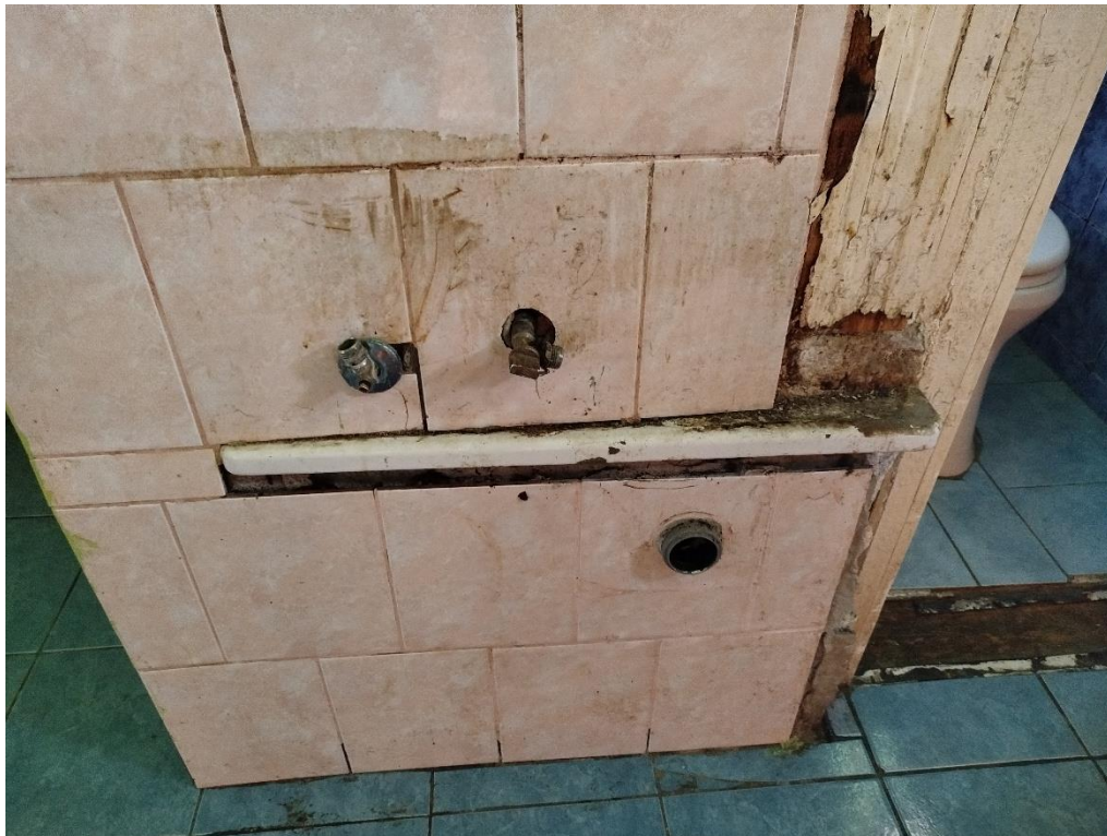
Fsz. 2. lakás fürdőszoba, szakszerűtlen kádbeépítés. A kád túlnyúlik a határoló fal síkján.