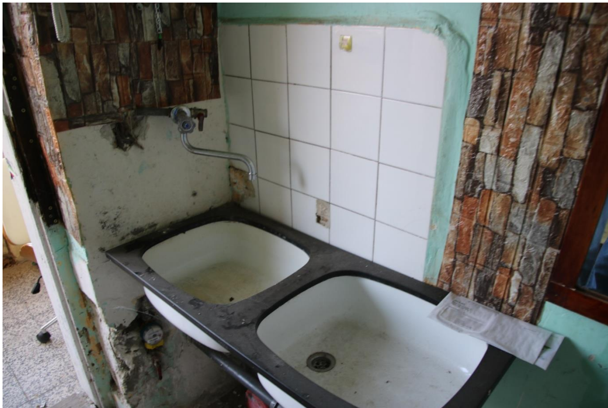
Fsz. 1. lakás. A konyhai mosogatót a folyosón helyezték el. A vízóra mellett a fal nincs helyreállítva, a burkolat hiányos, koszos, elavult.