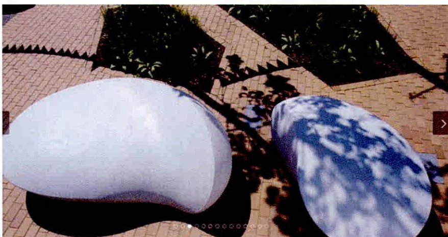
2. kép: Design ivókút