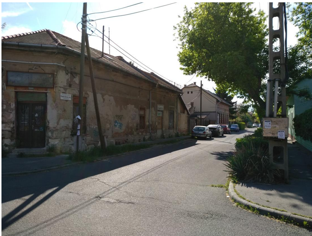
Az ingatlan bejárata: